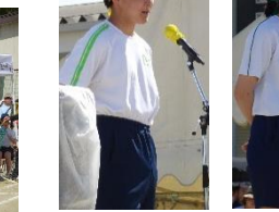
生徒会長挨拶 保健体育委員長挨拶