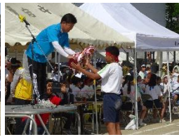
ナイスチーム賞【赤組】