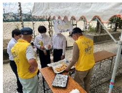
愛宕応援団による芋天販売